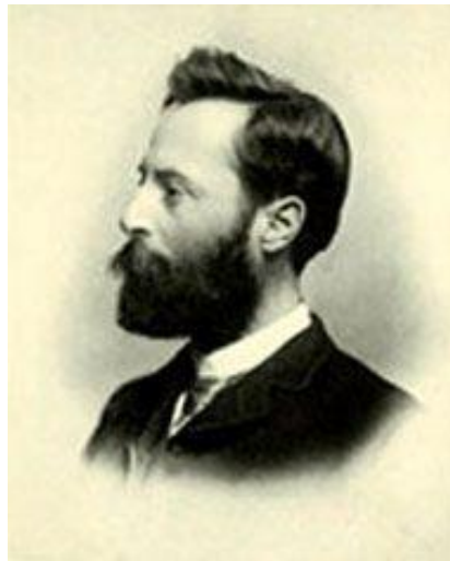
ภาพที่ 1.1 แฟรงค์ พาร์สันส์ (Frank Parsons ; 1854-1908)