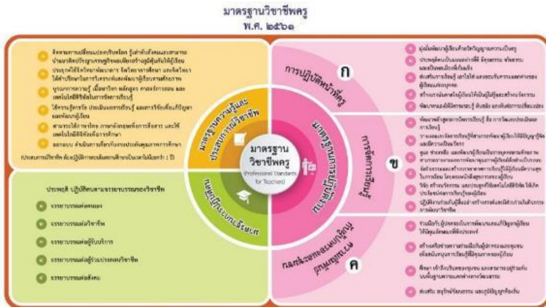
คณะกรรมการมาตรฐานวิชาชีพ คุรุสภา ๑๗ ธันวาคม ๒๕๖๑ (แผนภาพนี้สร้างขึ้นเพื่อความสอดคล้องกับมาตรา ๕๘ และ ๕๐ ตามพระราชบัญญัติสภาครูและบุคลากรทางการศึกษา พ.ศ.๒๕๖๑)