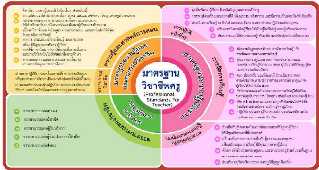
อ้างอิงตามข้อบังคับคุรุสภา ว่าด้วยมาตรฐานวิชาชีพ (ฉบับที่ ๔) พ.ศ. ๒๕๖๒